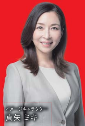
イメージキャラクター 真矢 ミキ