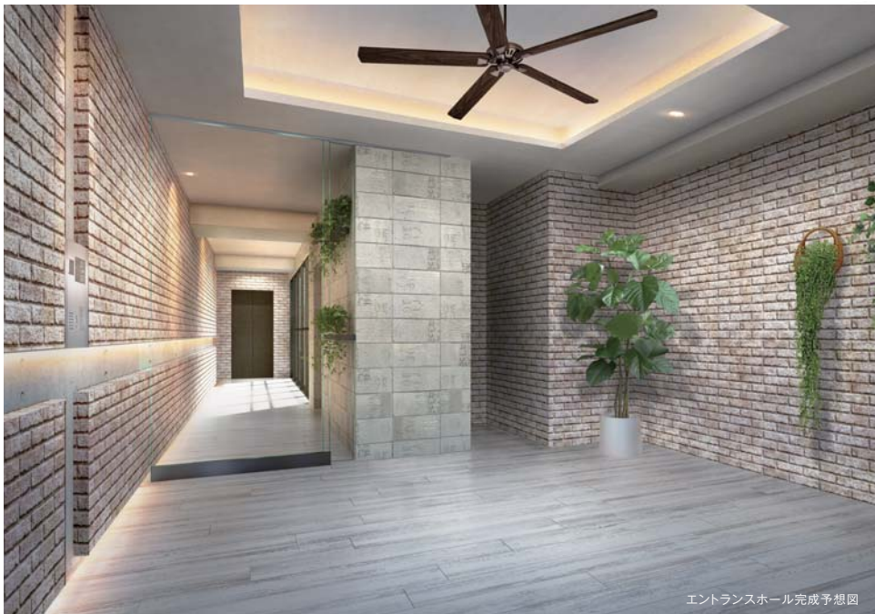
エントランスホール完成予想図